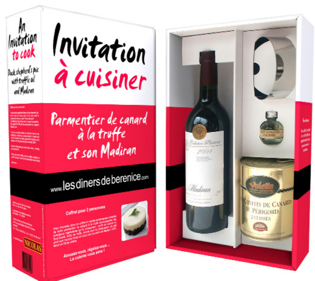
Parmentier de canard à la truffe et son Madiran

Laissez libre cours à votre imagination et à vos envies en dégustant avec gourmandise chaque ingrédient séparément !