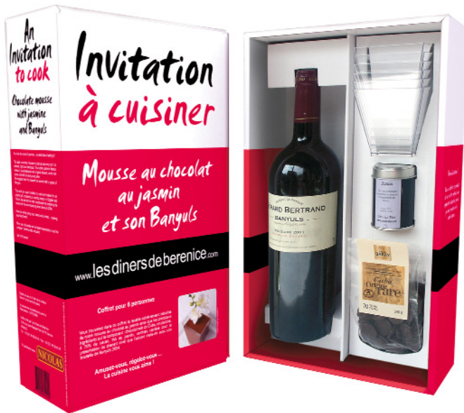
Mousse au chocolat au jasmin et son Banyuls

Vous cherchez LA bonne idée pour offrir à la fois un cadeau qui fait plaisir et un repas raffiné ? Les Dîners de Bérénice ont pensé à vous et sortent de leur toque les coffrets "Invitation à cuisiner"